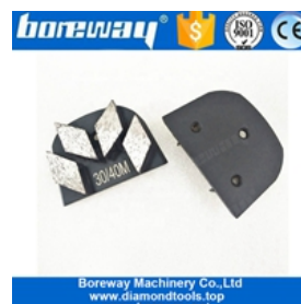
Vier Segmente Schleifschuhe