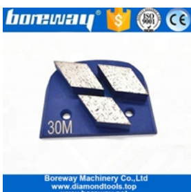
Drei Segmente, die Schuhe schleifen