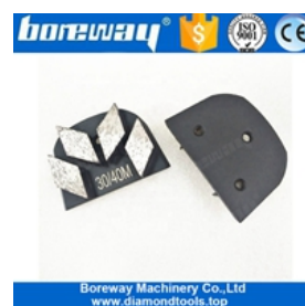
Vier Segmente Schleifschuhe