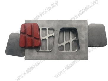
Mould for diamond floor grinding blocks

Boreway Machinery Co., Ltd. www.diamondtools.top www.boreway.com