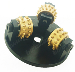
HTC 270MM Bush Hammer Plate

Boreway Machinery Co.,Ltd www.fordiamondtools.com www.diamondtools.top