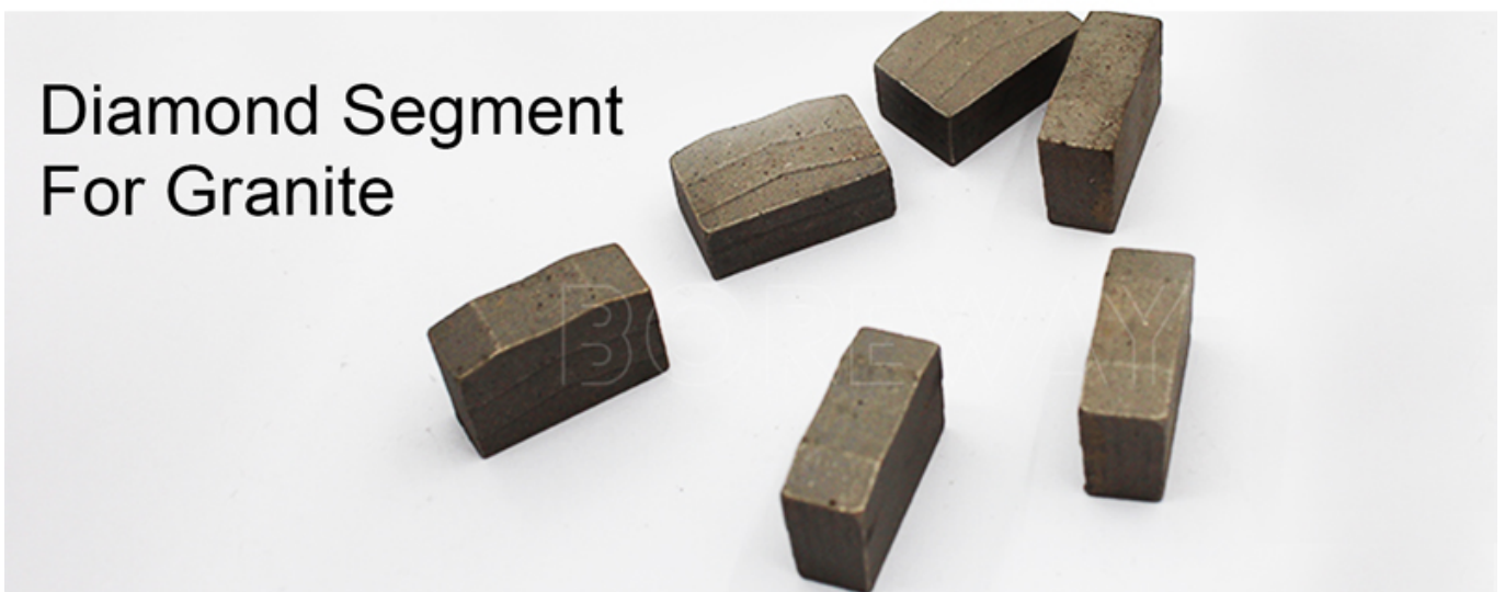
Diamond Segment For Granite