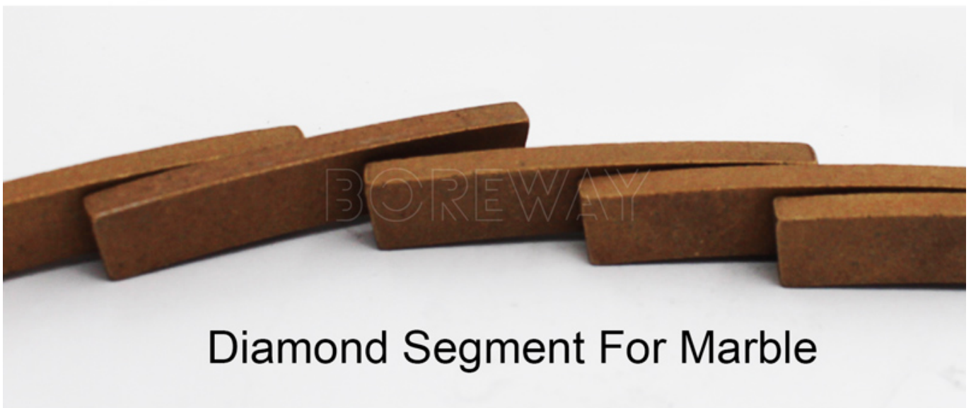
Diamond Segment For Marble