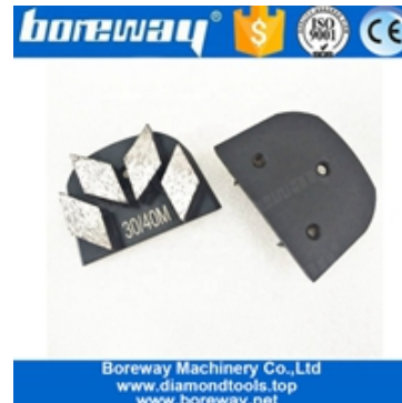
Vier Segmente Schleifschuhe