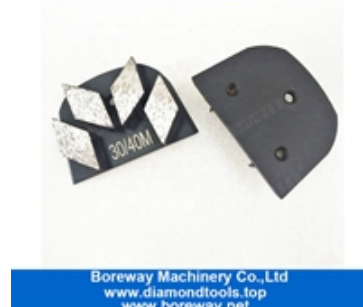
Vier Segmente Schleifschuhe