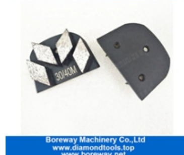
Vier Segmente Schleifschuhe