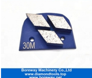
Drei Segmente, die Schuhe schleifen