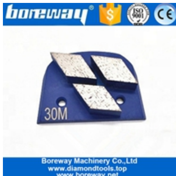
Drei Segmente, die Schuhe schleifen