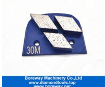
Drei Segmente, die Schuhe schleifen