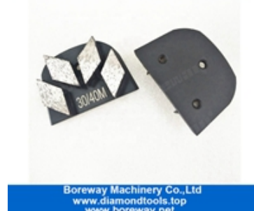
Vier Segmente Schleifschuhe