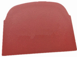
Lavina Quick Lock Blank