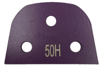
Lavina Blank with 3 Bare Holes