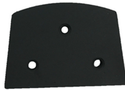
Lavina Blank with 3 M6/M8 Threads