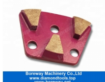
3 Trapezscheifschuhe 3 quadratische Schleifschuhe