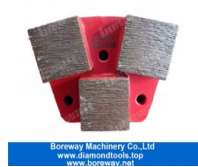
3 Trapezscheifschuhe 3 quadratische Schleifschuhe