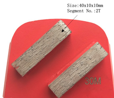
Lavina Concrete Floor Diamond Grinding Plate

Wenn Sie sich für unsere Produkte interessieren, können Sie mich anklicken.