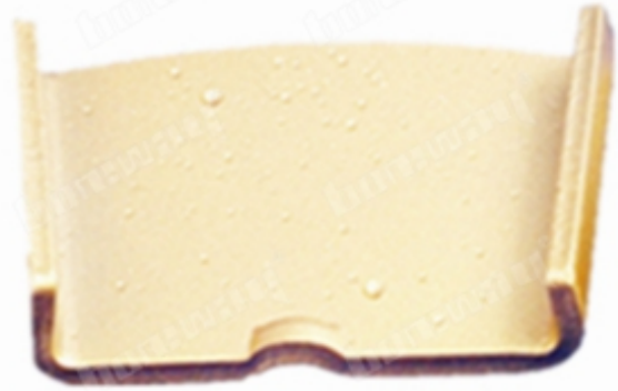
Double Oval Shape