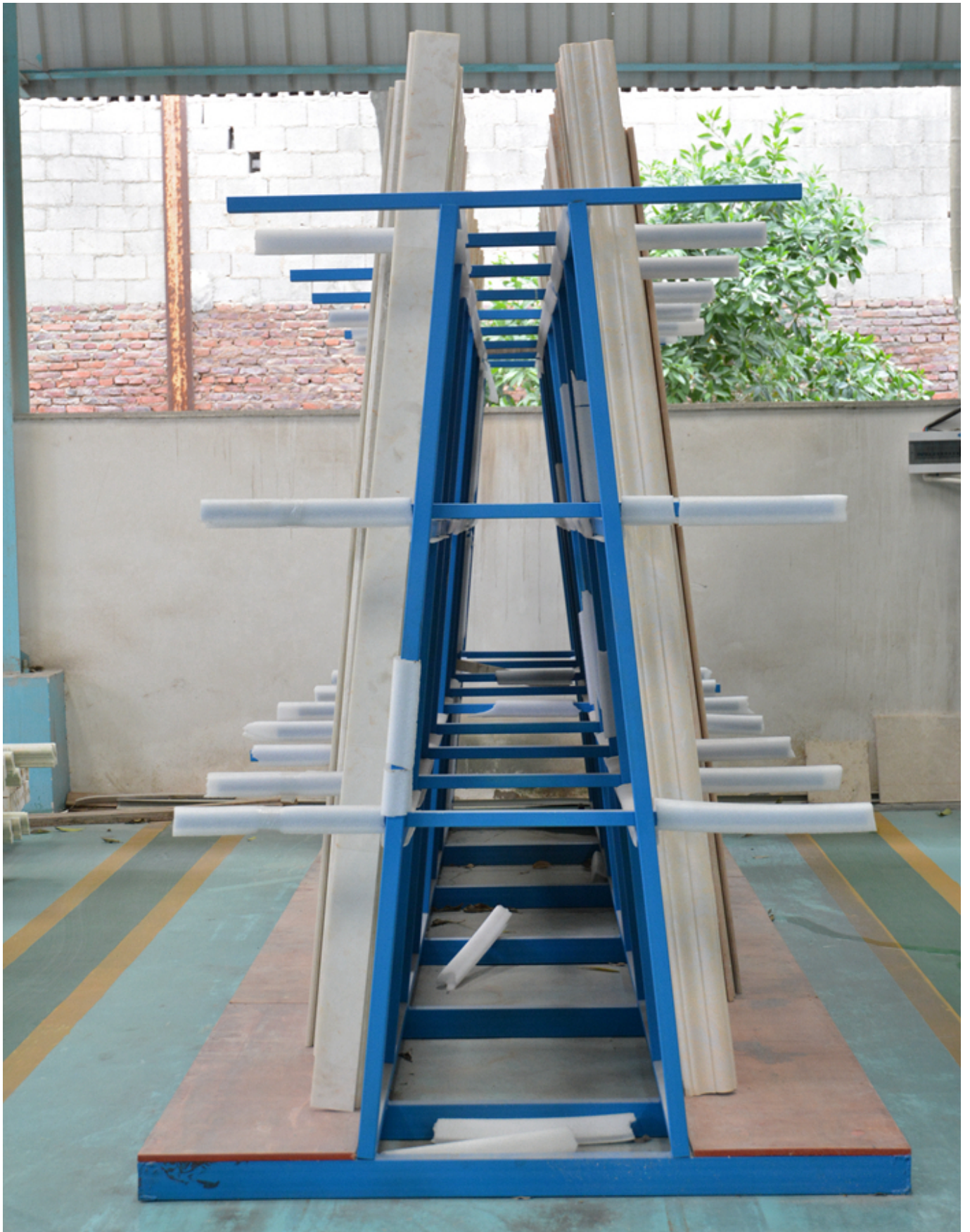
Verpackung & Lieferung