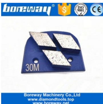
Drei Bereiche des Schuhschleifens