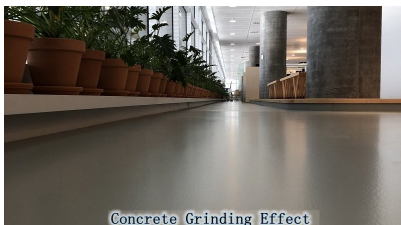
Concrete Grinding Effect