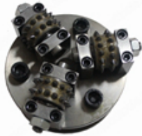
Boreway Machinery Co., Ltd www.diamondtools.top www.boreway.com