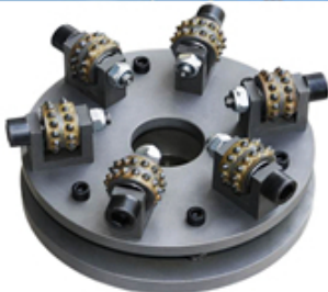
Boreway Machinery Co., Ltd www.diamondtools.top www.boreway.com