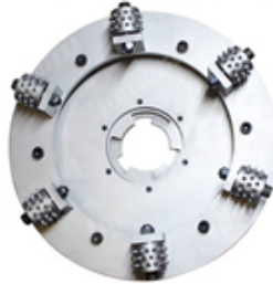
Boreway Machinery Co., Ltd www.fordiamondtools.com www.diamondtools.top