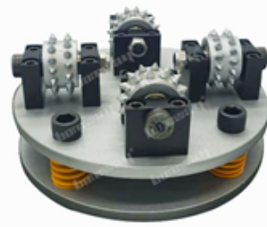
Boreway Machinery Co., Ltd www.fordiamondtools.com www.diamondtools.top