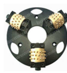
Boreway Machinery Co., Ltd www.fordiamondtools.com www.diamondtools.top