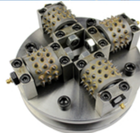
Boreway Machinery Co., Ltd www.diamondtools.top www.boreway.com