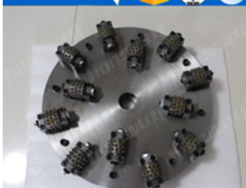
Boreway Machinery Co., Ltd www.diamondtools.top www.boreway.com