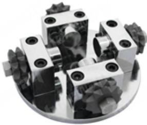
Boreway Machinery Co., Ltd www.diamondtools.top www.boreway.net