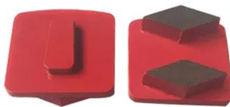
Trapezoid Redi Lock Plate