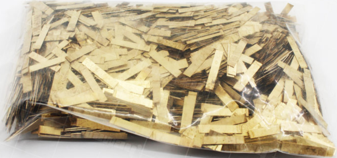
Copper Welding Sheet For Diamond Saw Blade Segment