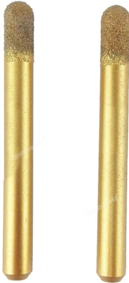
Vacuum Brazed Diamond engraving bit

Boreway Machinery Co., Ltd. www.diamondtools.top www.boreway.com