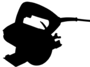
Circular Saw Machine