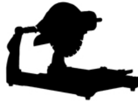
Masonry Saw Machine