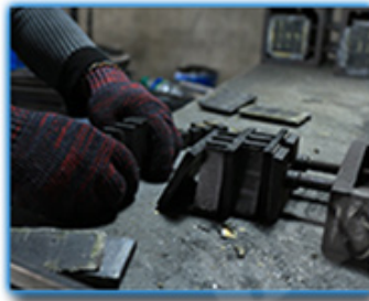
● Remove The Mold