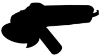
Angle Grinder Machine

Fabrikpreis 105MM Smooth Cutting Mesh Blade benutzen zum Winkelschleifer, Kreissäge, Mauerwerksäge, Tischkreissäge