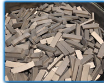
● The Product Polishing