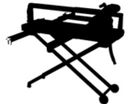
Table Saw Machine