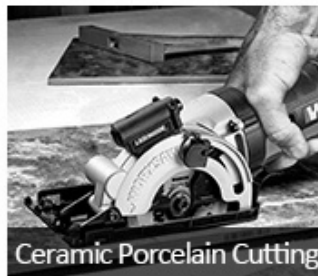
Ceramic Porcelain Cutting