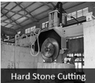
Hard Stone Cutting