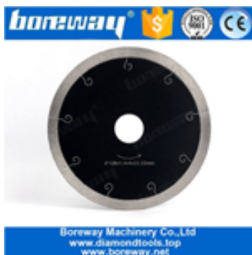
5 Zoll heißgepresste Segmente Schneidscheibe