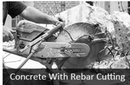
Concrete With Rebar Cutting