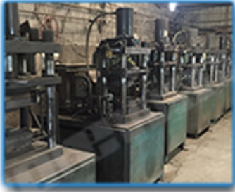
● Hot Press Machinery