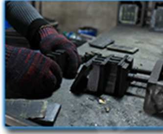
● Remove The Mold