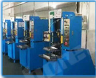
● Cold Press Mschine