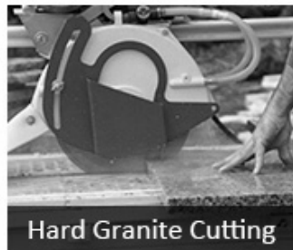
Hard Granite Cutting