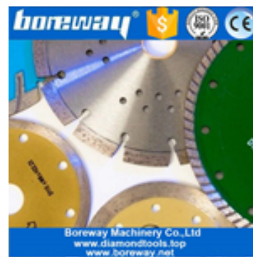
Querschnitt Diamant Segmentierte Sägeblätter