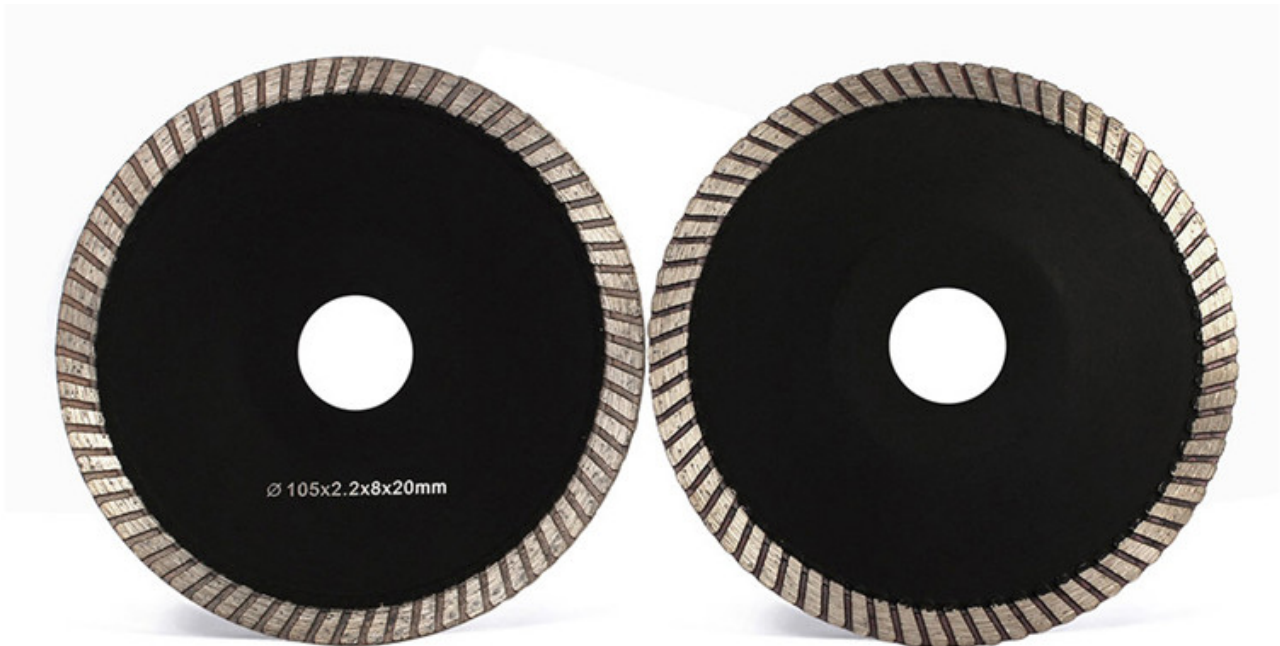
5 Inch Concave Diamond Cutting Blade