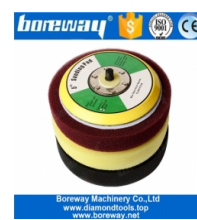
5 Zoll Foam Backer Pad