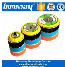
5/16 "-24 Gewinde Backer Pad