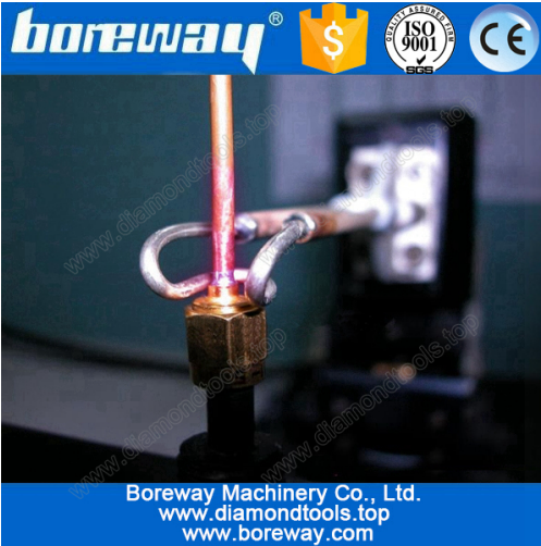
Copper tube welding