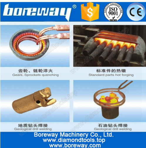
A variety of materials welding

Anhang: Fußschalter / Hand-Schalter, Heizregister (kann angepasst werden), Wasserleitungen, Wasserpumpen (müssen kaufen).