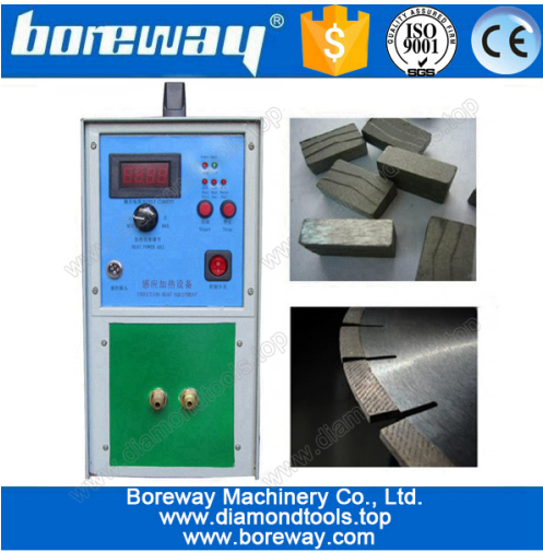
Diamond saw blade welding