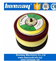
5 Zoll Foam Backer Pad