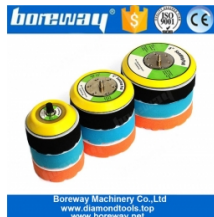
5/16 "-24 Gewinde Backer Pad