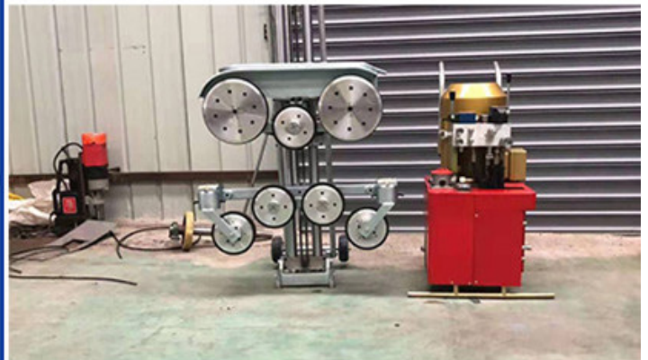
Hydraulic Wire Saw Cutting Machine