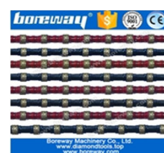
Diamond Saw Hire