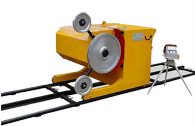
Electric Wire Saw Cutting Machine

Gelötete Diamant-Schneidedrahtsäge kann mit Diamantdrahtmaschine verwendet werden.