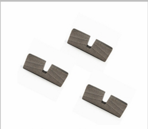
Granite Edge Cutting Segment