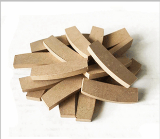
Marble Edge Cutting Segment