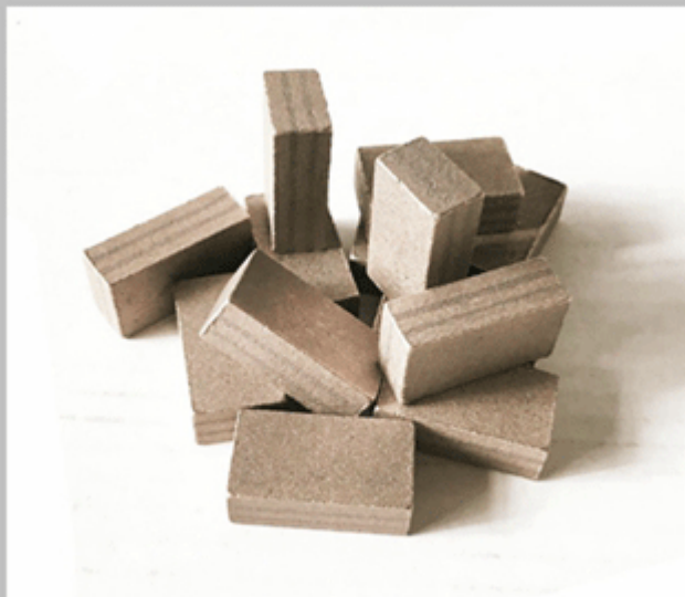
Marble Block Cutting Segment