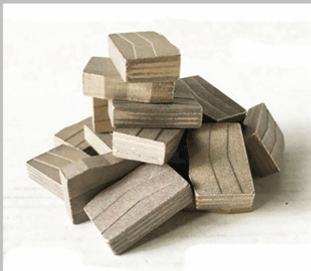
Granite Block Cutting Segment