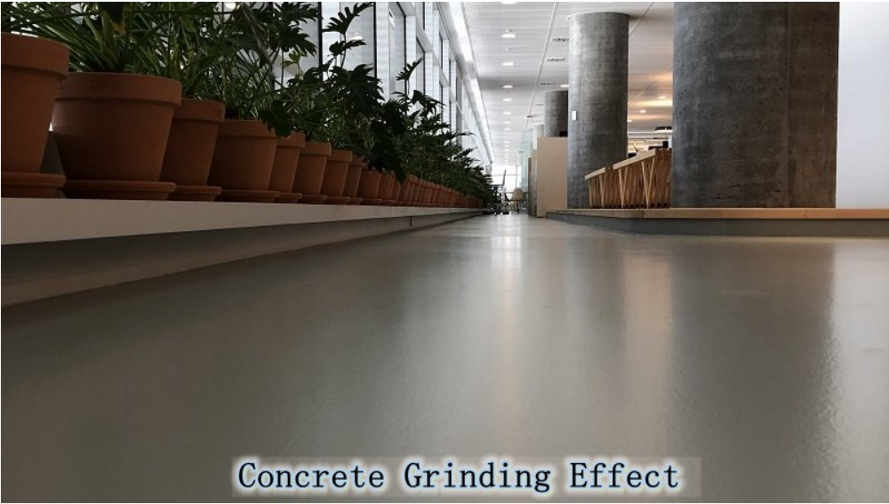
Concrete Grinding Effect