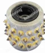
Boreway Machinery Co.,Ltd www.fordiamondtools.com www.diamondtools.top