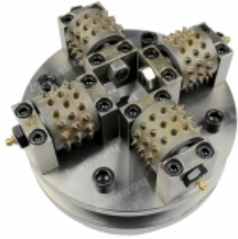
Boreway Machinery Co.,Ltd www.fordiamondtools.com www.diamondtools.top