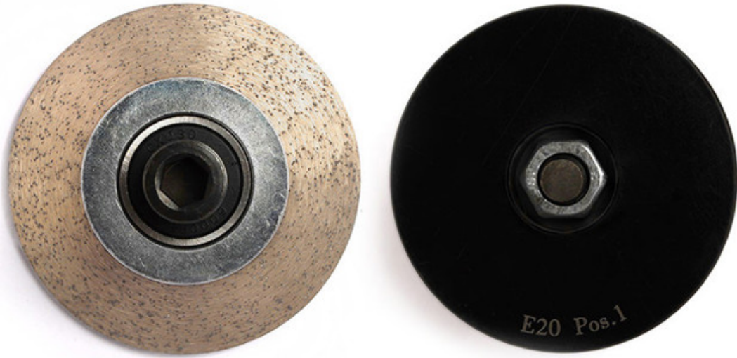
M10 Thread Diamond Profile Wheel