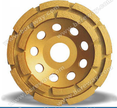
Boreway Machinery Co., Ltd. www.diamondtools.top www.boreway.com