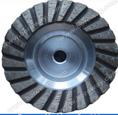
Boreway Machinery Co., Ltd. www.diamondtools.top www.boreway.com