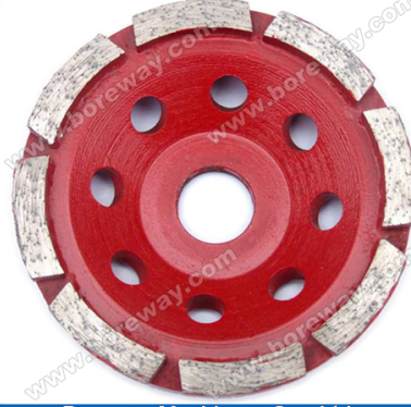
Boreway Machinery Co., Ltd. www.diamondtools.top www.boreway.com