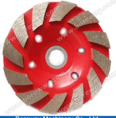
Boreway Machinery Co., Ltd. www.diamondtools.top www.boreway.com