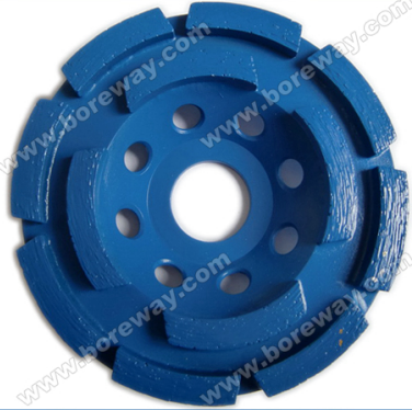
Boreway Machinery Co., Ltd. www.diamondtools.top www.boreway.com