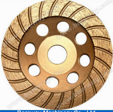
Boreway Machinery Co., Ltd. www.diamondtools.top www.boreway.com