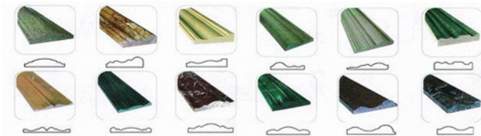
异形磨边效果 Type of profile stone