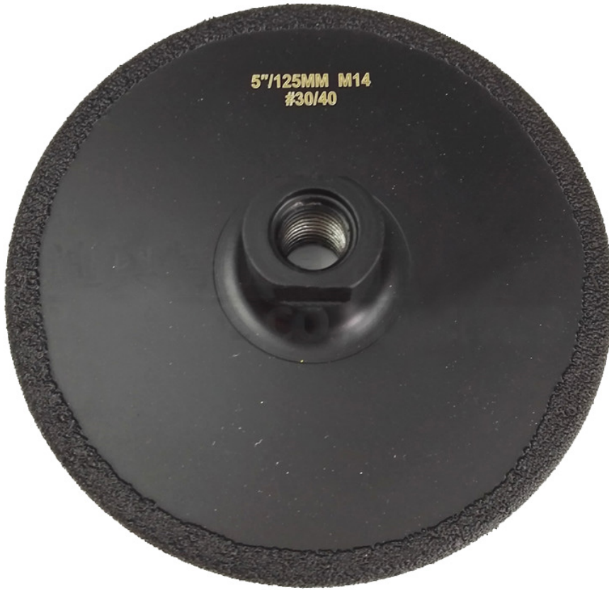
M14 Thread Vacuum Brazed Diamond Grinding & Cutting Wheel