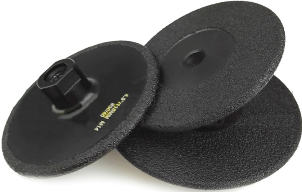
Vacuum Brazed Diamond Grinding Wheel

Boreway Machinery Co., Ltd. www.diamondtools.top www.boreway.com