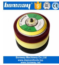
بوصة رغوة باكر الوسادة 5