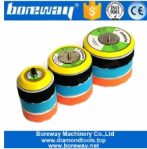
5/16 \"-24 Thread Backer Pad