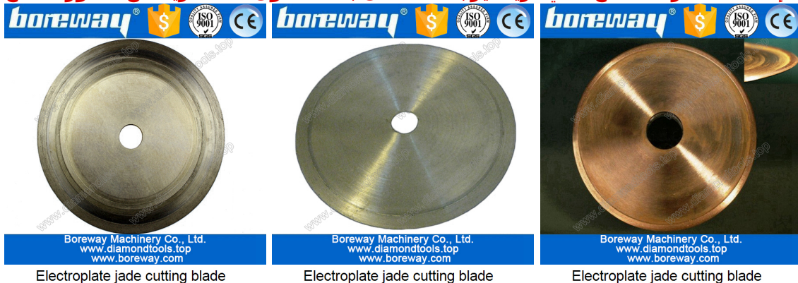
Electroplate jade cutting blade

يظهر التالية فقط جزء من المنتج، ومنتجات أخرى يمكن تخصيصها وفقا لاحتياجاتك. إذا كنت لا ترى المنتج الذي تريد، يرجى الاتصال بنا للحصول على مزيد من الصور المنتج.