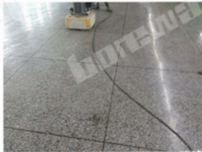
Before Grinding and Polishing