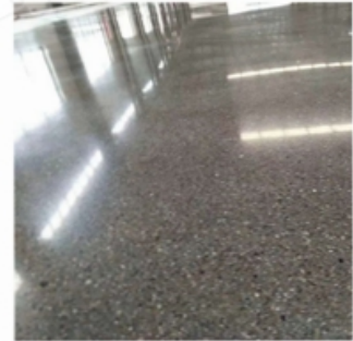
After Grinding and Polishing