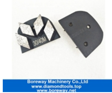
أربعة قسم طحن الأحذية