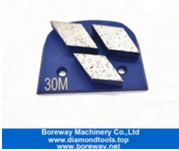
ثلاثة قسم طحن الأحذية