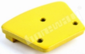
3 X M6/M8 Thread Holes