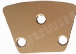
3 X Bare Holes