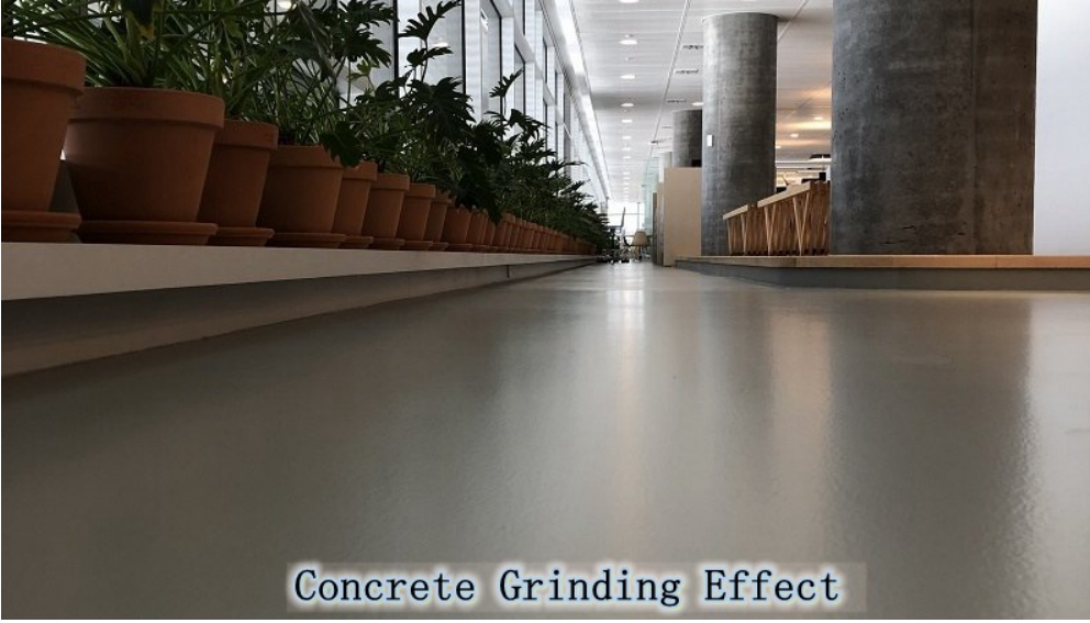
Concrete Grinding Effect