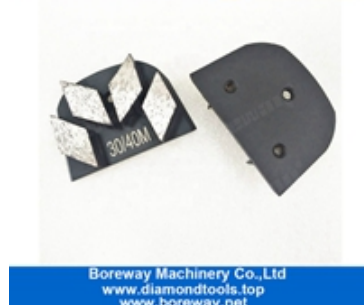
أربعة قطاعات طحن الأحذية