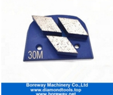
ثلاثة قطاعات طحن الأحذية