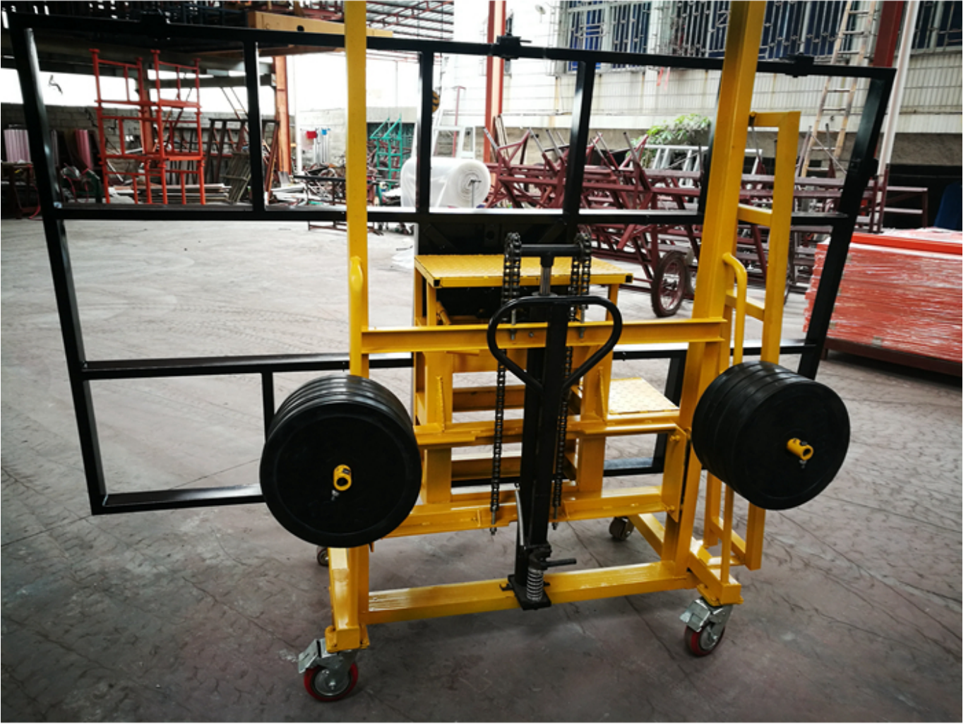
التعبئة & أمب؛ توصيل