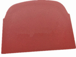
Lavina Quick Lock Blank