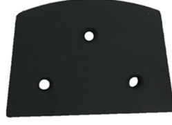
Lavina Blank with 3 M6/M8 Threads