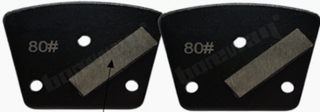
Size: 40*10*10mm*1T Single Bar Segment

شريط واحد شبه منحرف الماس طحن رئيس للخرسانة وترازو الكلمة: