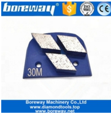
ثلاثة أجزاء طحن الأحذية