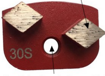
Connection Type: Polar Magnetic System; Single Hole System

Segment Size: 18mm*20mm*2T Segment Shape: Rhombus