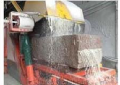
Mu lit blade block cutter (Multi Sizes)