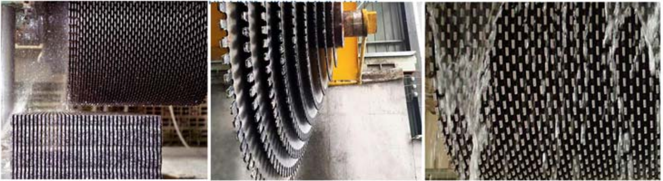
Multi blade block cutter (Single Size)