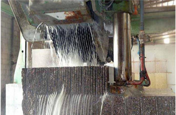
Single Saw Blade