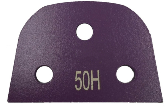
Lavina Blank with 3 Bare Holes