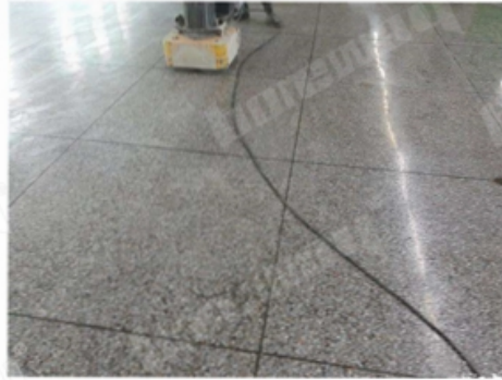
Before Grinding and Polishing