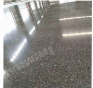
After Grinding and Polishing